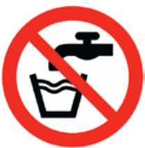
Abbildung 2: Zeichen für „Kein Trinkwasser“

Nichttrinkwasserleitungen sind nach der Trinkwasserverordnung und nach DIN 2403 eindeutig und dauerhaft farblich unterschiedlich zu kennzeichnen, damit es zu keiner Verwechslung kommt. Alle Entnahmestellen der RWNA sind mit einem Schild „Kein Trinkwasser“ oder dem Bild (Abb. 2) zu kennzeichnen.